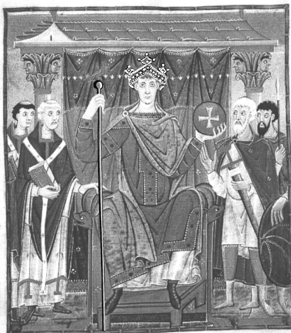
Wizerunek Ottona III