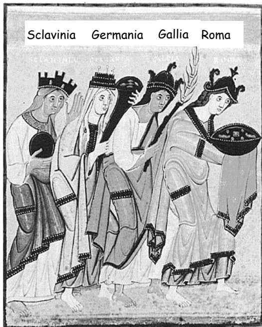
Personifikacje ziem europejskich (Roma, Gallia, Germania i Scлавinia 1 ) składają hołd Ottonowi III.