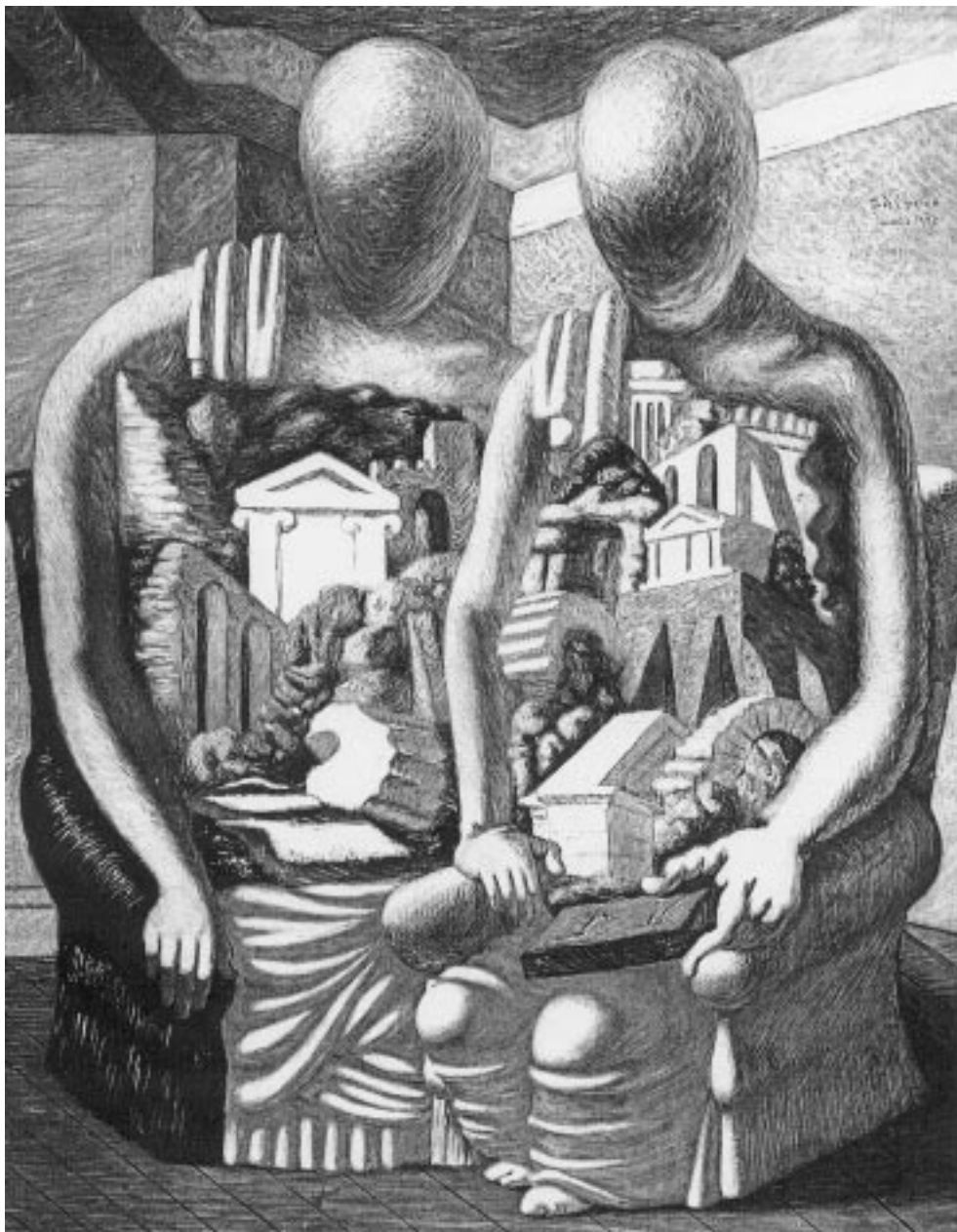
Giorgio de Chirico, Dwóch archeologów , [za:] Wielcy malarze , nr 133.