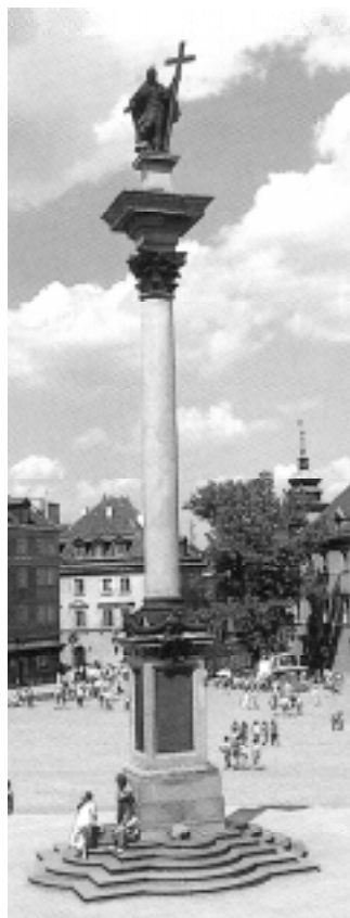
Kolumna Zygmunta III Wazy w Warszawie