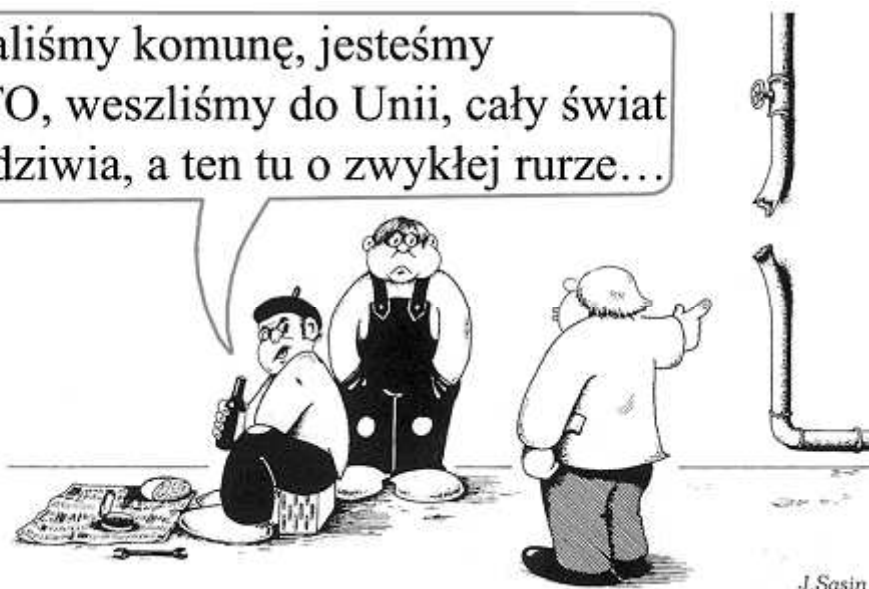
Jacek Sasin, Do Unii i z powrotem .